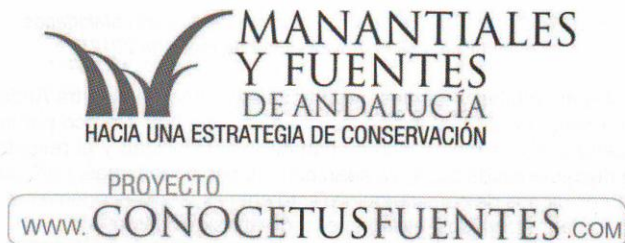
FIGURA 1. Distintivos de la Estrategia y del Proyecto Conoce tus Fuentes

Para una correcta planificación y gestión del agua es imprescindible el conocimiento de los recursos disponibles, siendo las personas que realmente habitan o usan el territorio, los verdaderos "expertos" de los manantiales y fuentes locales. Toda la información es volcada y compartida en la citada web: www.conocetusfuentes.com , el punto de encuentro de todos los entusiastas de los manantiales andaluces.