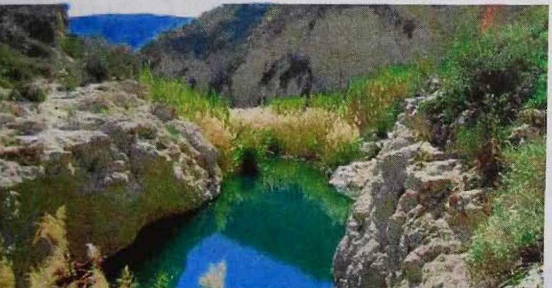
Nacimiento del río Aguas en el desierto de Tabernas. A.C.

En la provincia de Almería el itinerario comienza en los Baños de Sierra Alhamilla. «Presenta la singularidad de contar con las aguas termales más calientes de toda Andalucía, que brotan nada menos que a 58 °C. Una rareza geológica que justifica la visita a este antiguo balneario, localizado en Pechina, cerca de Almería capital».