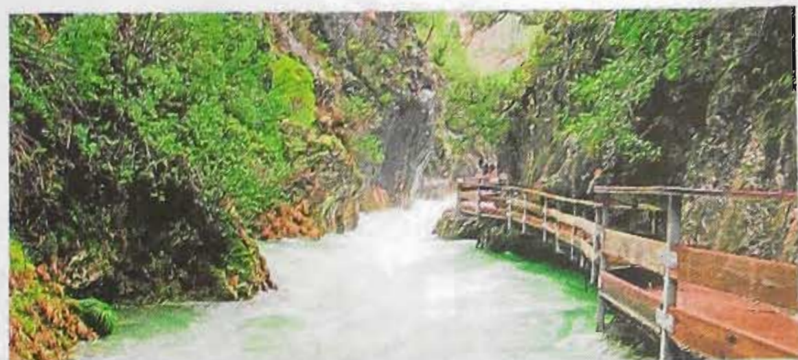
Río Borosa en el Parque de Cazorla, Segura y Las Villas. A.C.

Para finalizar esta propuesta turística para conocer los rincones más singulares de nuestro entorno vamos hasta el embalse de Beninar, en el río Adra, que recoge escorrentías de Sierra Nevada oriental, en parte procedentes de la provincia de Almería, allí existe un excelente nacimiento. Se trata de las fuentes de Marbella, cuyas aguas son apreciadas como verdadero oro líquido para regadíos y abastecimientos urbanos en el litoral almeriense.