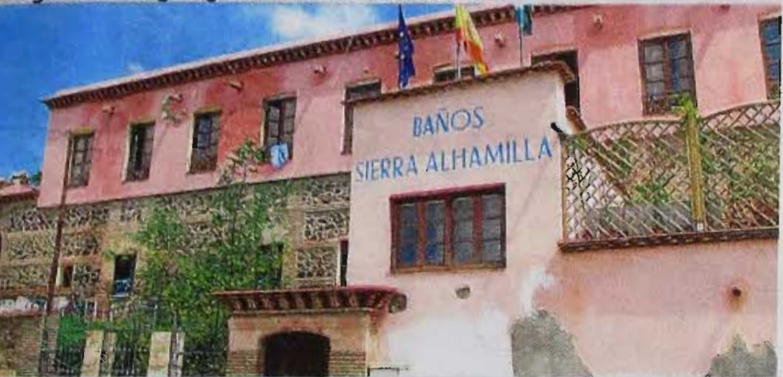
Baños termales de Pechina en Almería. A.C.