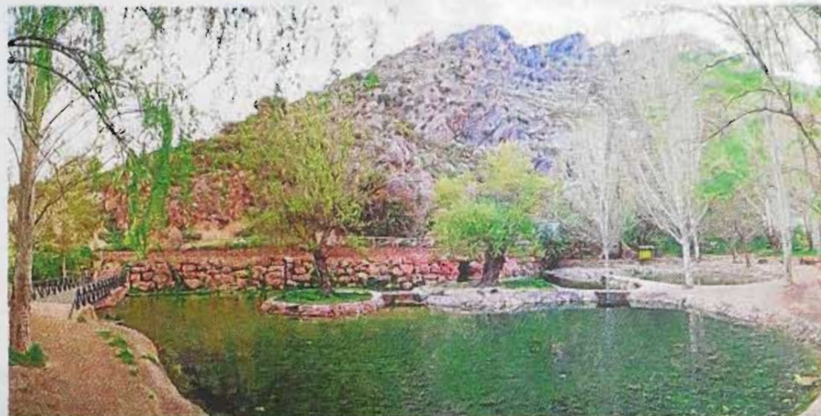
Entorno del nacimiento del río San Juan. A.C.