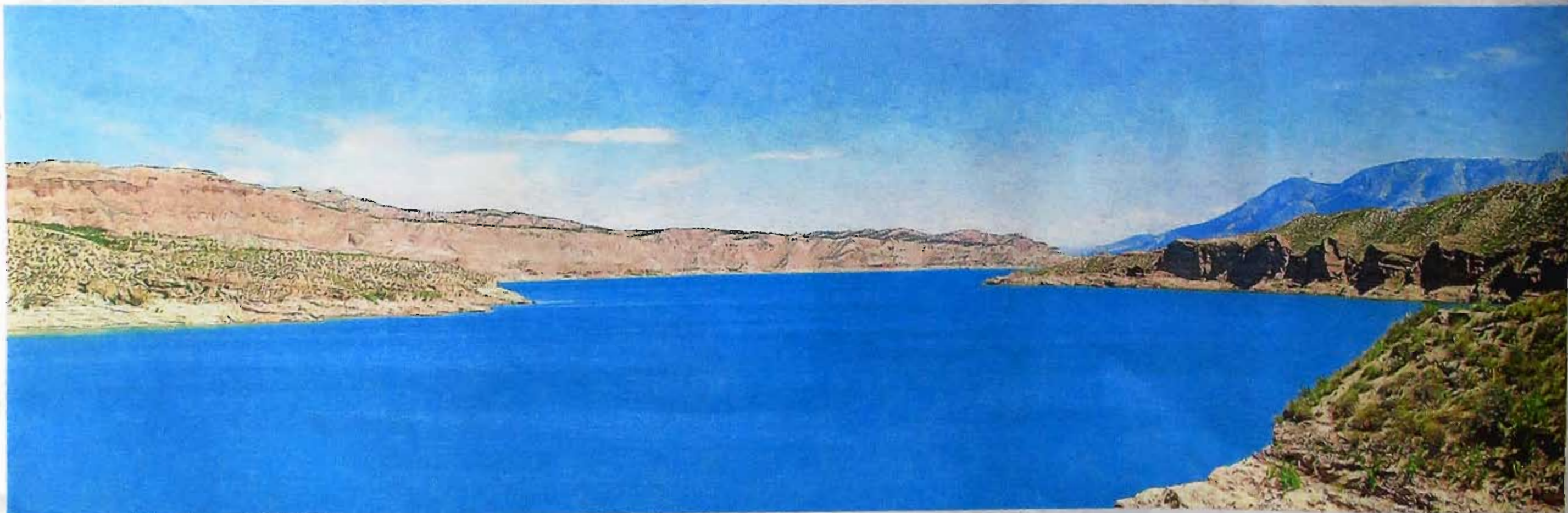
Perspectiva del embalse del Negratín, el más grande de la provincia de Granada. Antonio Castillo.

permite disfrutar tranquilamente del burbujeo de las aguas que salen de afloramientos calizos. De cualquier forma, esta provincia dispone aún de otros muchos nacimientos similares».