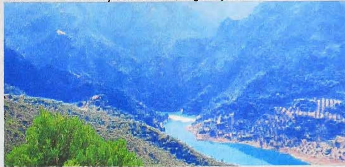
El embalse de Quiebrajano en la Sierra Sur de Jaén. A.C.