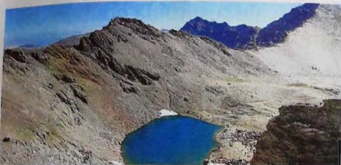
Laguna de origen glaciar en Sierra Nevada. A.C.