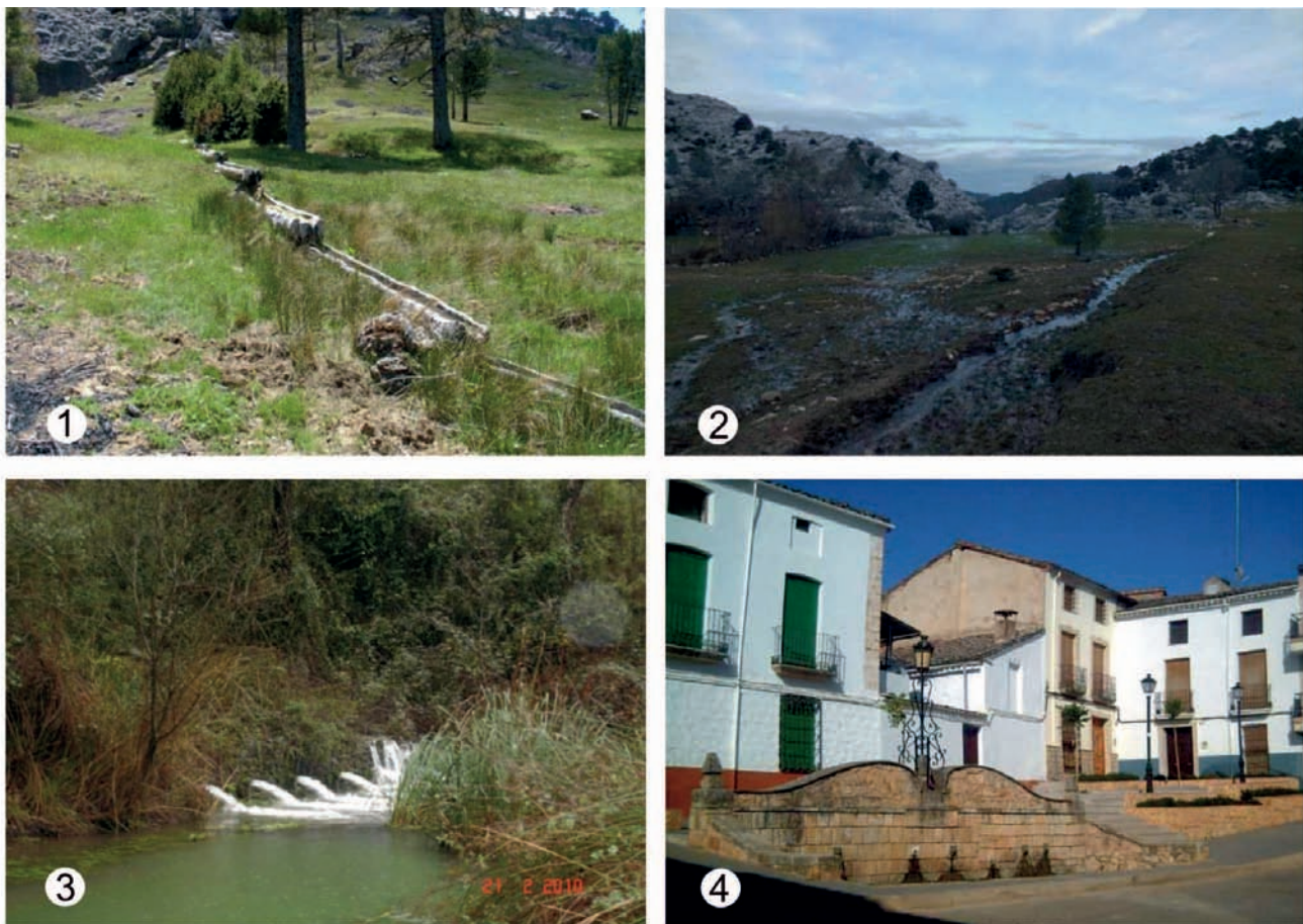
Figura 3. Cuatro tipos de surgencias, con mayor o menor acondicionamiento, de la comarca de las Villas; 1- Abrevadero, en forma de tornajos, de Cañada Somera (Iznatoraf), 2- Nacimiento natural de los Chortales (Villacarrillo), 3- Nacimiento a cauce, Fuente Negra (Villanueva del Arzobispo), 4- Fuente urbana de los Caños (Sorihuela del Guadalimar)

Desde aquí se invita a todos los lectores a pasear por cada uno de los cuatro municipios que componen la bellísima comarca de Las Villas y a aportar a CTF todos aquellos datos de manantiales que aun no se encuentren presentes o que sean incorrectos. Por su parte, en conocetusfuentes.com encontrarán una amplia información sobre los manantiales de la comarca de las Villas, y de Andalucía en su conjunto, así como artículos de opinión, técnicos y científicos, miles de fotografías e información de eventos, noticias y actividades de interés relacionadas con estos temas.