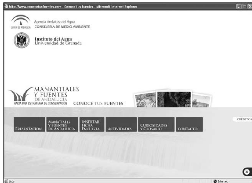
Pantalla de inicio de www.conocetusfuentes.com .

Como se ha comentado, el hilo conductor de este proyecto es la Web www.conocetusfuentes.com . En ella se está alojando abundante y variada información sobre manantiales y fuentes de Andalucía, las fichas catalogadas hasta el momento (en el botón: “Manantiales y Fuentes de Andalucía”) y la ficha encuesta para introducir nuevos manantiales (botón: “Insertar ficha encuesta”). Toda la información es descargable, y en especial la documental y fotográfica sobre manantiales y fuentes catalogadas hasta el momento.